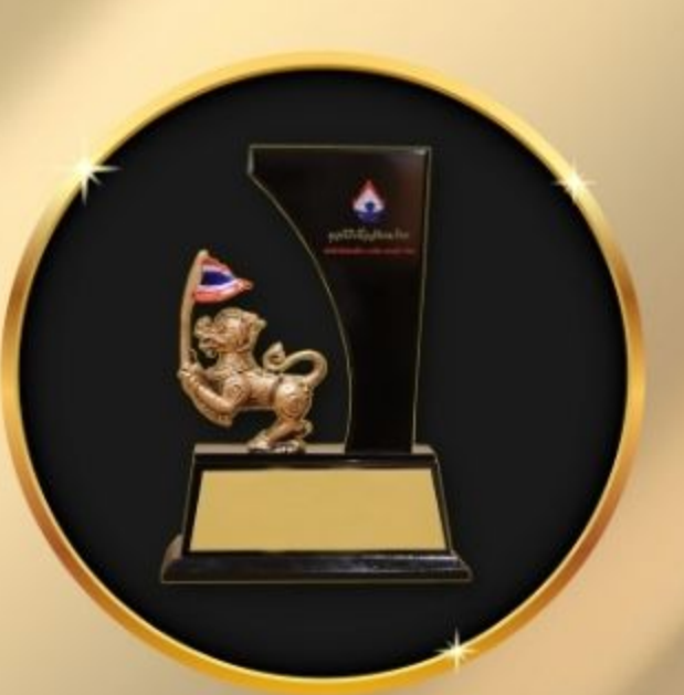
รางวัล องค์กรปกครองส่วนท้องถิ่นที่มีความเป็นเลิศ