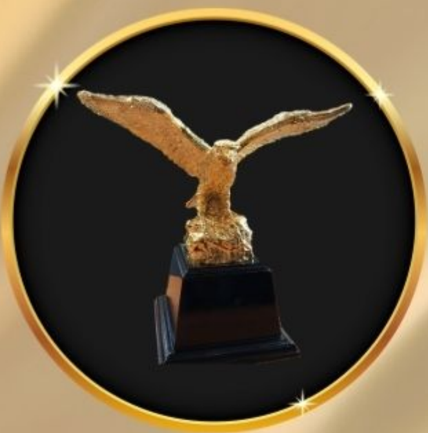
รางวัล ผู้นำท้องถิ่นดีเด่น