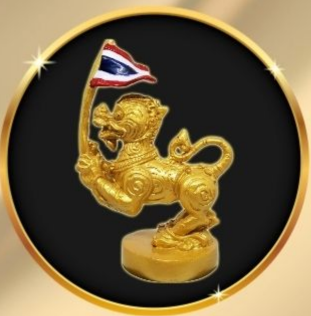
รางวัล นักปกครองท้องถิ่นดีเด่น