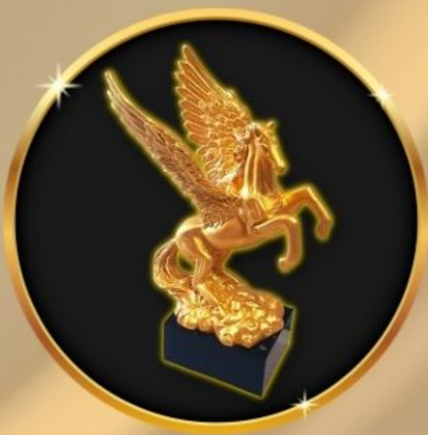
รางวัล สุดยอดผู้นำท้องถิ่น