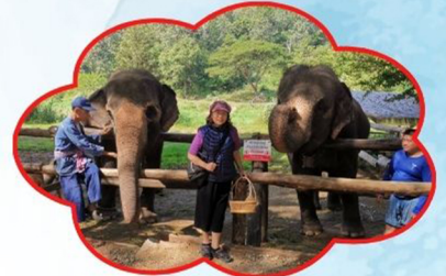
แสนรู้(ดัมมี่)+ยูย

องค์กรปกครองส่วนท้องถิ่น และ ศูนย์อนุรักษ์ช้างไทย หรือ สถาบันเทศบาลแห่งชาติ ในพระอุปถัมภ์ จังหวัดลำปาง